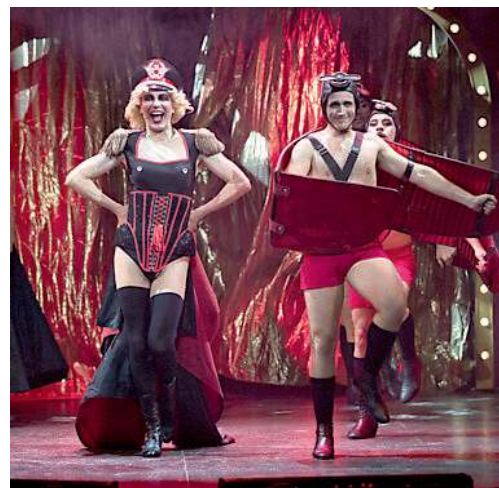
Il progetto di Cabaret è tutto torinese

to a portata di clic e arrivano a essere nauseati dalle immagini. Questo annienta la voglia di scoprire e la fantasia, il cellulare ha ucciso l'immaginazione perché ogni cosa è accessibile allo sguardo».