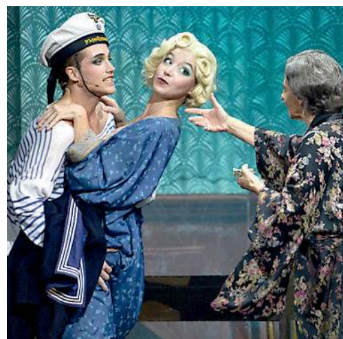
Il musical sarà in scena da oggi a domenica

«I giovani continuano a trasgredire, ma è diventato tutto fluido e la trasgressione è ormai banalizzata. Il problema è che i ragazzi hanno tut-